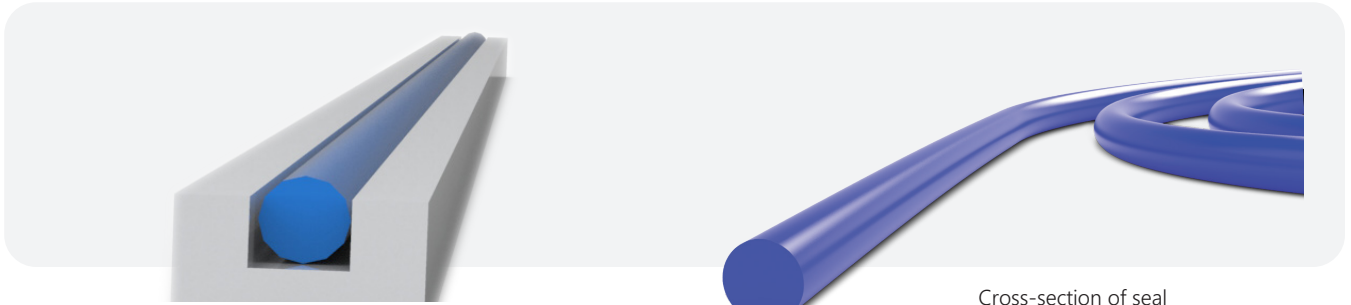
Recommended groove dimension Machining tolerance: \pm 0,05