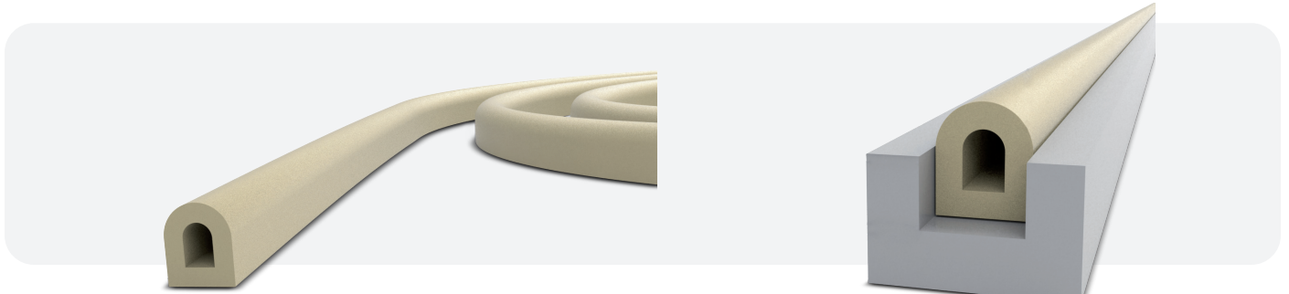
Section du joint