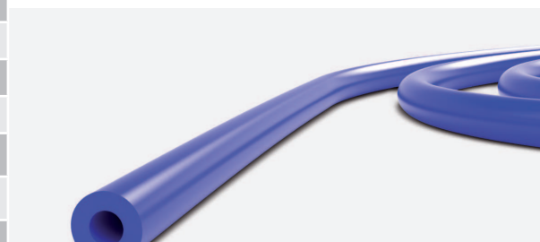
Section du joint