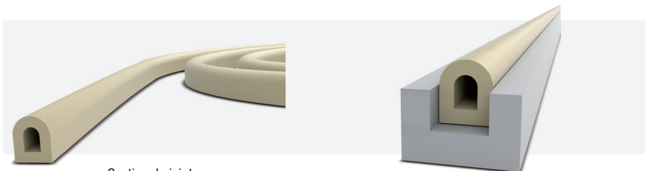
Section du joint