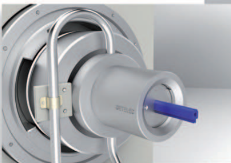
4. Extrusion sur-mesure