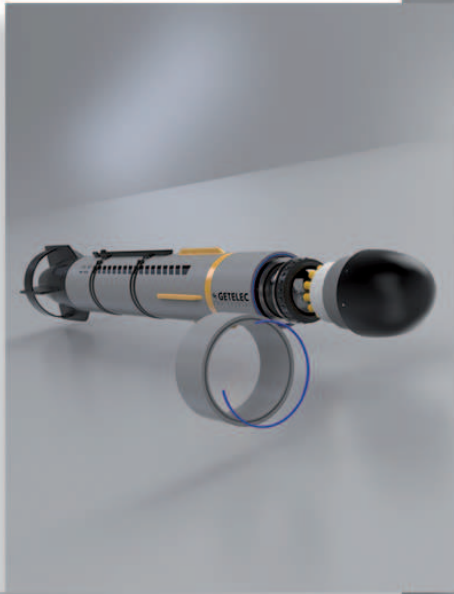
1. Prise en compte des contraintes