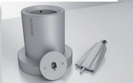
3. Fabrication des outillages